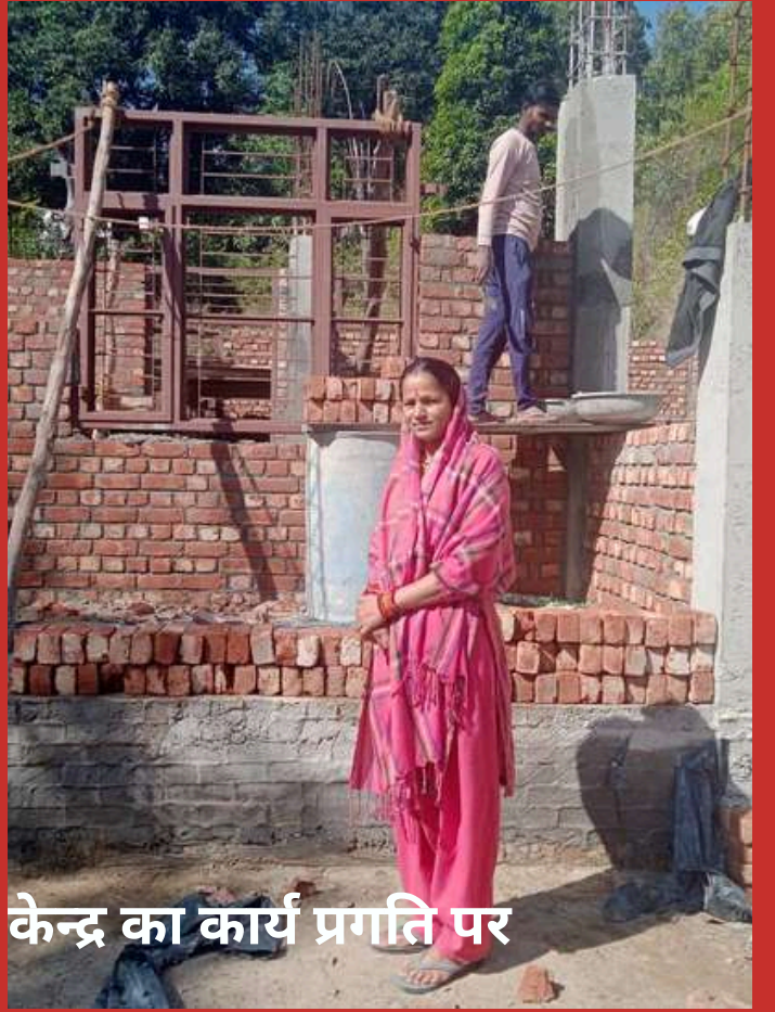
ग्राम में निर्माणाधीन पशु सेवा केन्द्र का कार्य प्रगति पर